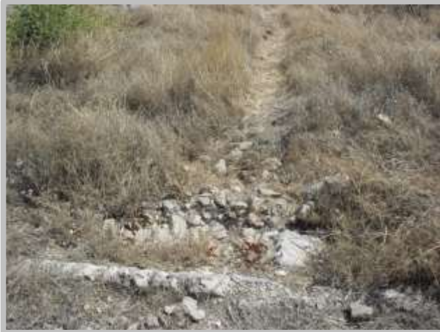
Resim 5(Temiz Su Kanalı)