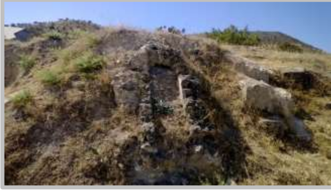
Resim6(Kirli Su Kanalı)