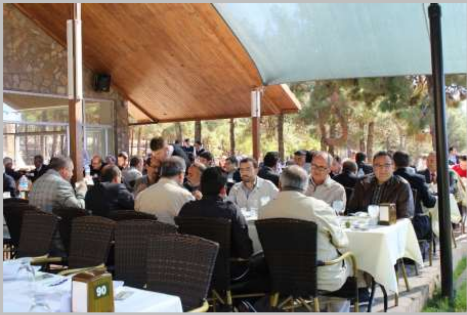
Fotoğraf 12 - Şehitkâmil Belediyesi Dülük Baba Tesisleri'nde Veda Yemeđi