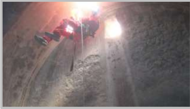
Resim 4(Büyük Sarnıç)